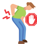
Limitation de mouvements